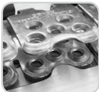
Schnelles und genaues Einlegen der Verbinderstreifen.